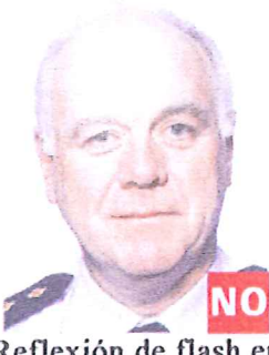
Reflexión de flash en la piel