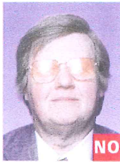
Reflexión en los cristales