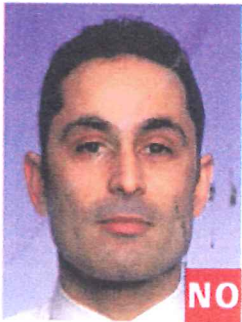
Marcas de Tinta o rasgada