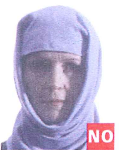
Sombras en la Cara