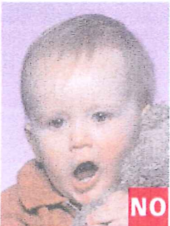
Boca abierta y presencia de un objeto