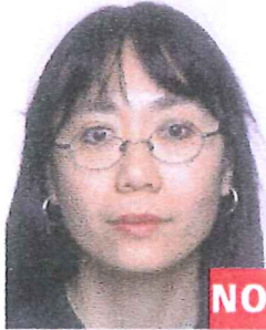
Montura tapando parte de los ojos