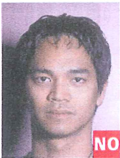
Sombras tras la cabeza