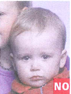
Presencia de otra persona