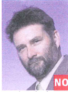
Línea de ojos inclinada