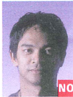
Sombras en la cabeza