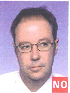
Sin mirar de frente