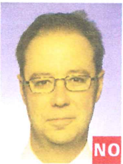
Tono de piel no natural