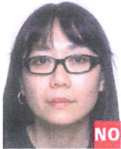
Monturas demasiado gruesas