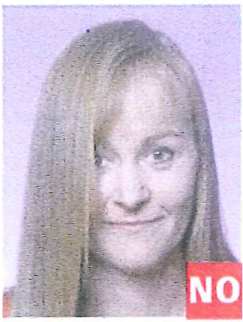
Pelo en los ojos